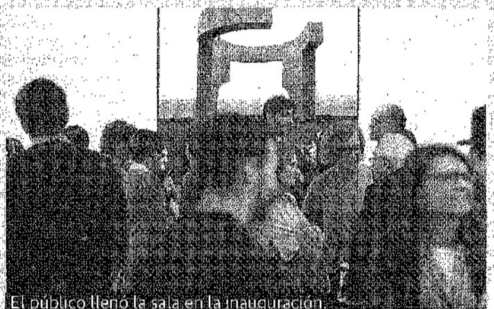
El público llenó la sala en la inauguración.